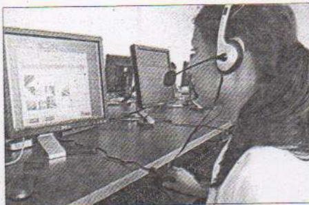
Fomentarán el acceso a nuevas tecnologías en estudiantes

"Las prioridades no cambian. Vimos un buen desarrollo en la transición política de este año y las prioridades del anterior gobierno de apoyo a los jóvenes, a la educación y la competitividad empresarial se han respetado"