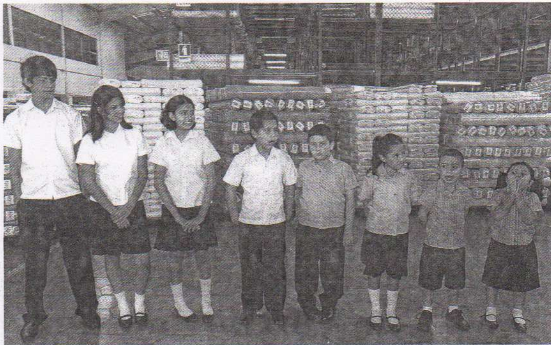
Aporte. El MINED ejecutará acciones como capacitación a docentes de educación media técnica, equipamiento tecnológico a institutos de educación media, readequación física de espacios para informática, diseño curricular para nueve bachilleratos técnicos, refuerzo académico y orientación vocacional, y otras.

“Allí está el Consejo Nacional de Educación... ese consejo tendrá que darle legitimidad porque no la tiene. Un consejo, de acuerdo al reglamento interior del Órgano Ejecutivo, solo adquiere validez cuando es el presidente el que lo ratifica y el ministro de Gobernación el que dice, técnicamente, que lo respalda. Yo estoy de acuerdo en la creación. Le debemos dar la oficialidad que debe tener. Los ministros no pueden crear consejos, no hay decretos ministeriales, hay decretos del Ejecutivo”, dijo Funes días atrás.